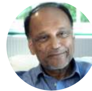
ПАРТА ДАСГУПТА Почетный профессор экономики Кембриджского университета