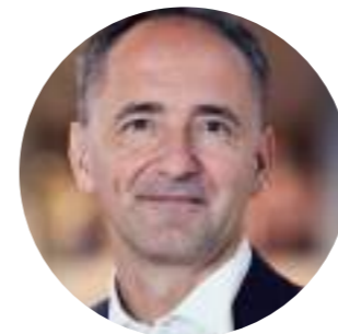
ДЖИМ ХАГЕМАНН СНЕЙБ Председатель Siemens, Попечитель Всемирного экономического форума