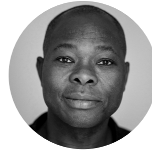
Фрэнсис Кере Основатель и руководитель Kéré Architecture, лауреат Притцкеровской премии 2022 г.