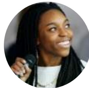
НЯША ХАРПЕР-МИШОН «Архитектурист», архитектор, LinkedIn Top Voice Green, бизнес- стратег, педагог, спикер, писатель