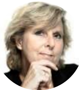
КОННИ ХЕДГАРД, Ведущая