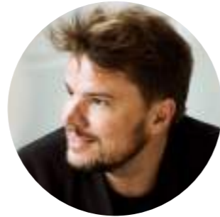
БЬЯРКЕ ИНГЕЛС Основатель компании BIG