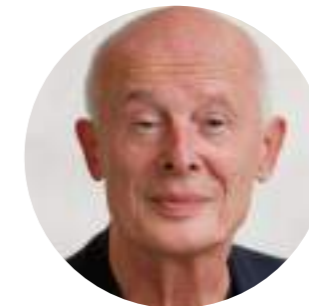
ХАНС ЙОАХИМ ШЕЛЛНХУБЕР Основатель и управляющий директор, Bauhaus Earth