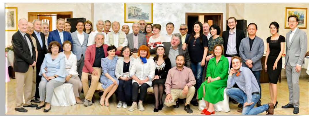
Коллектив кафедры «Архитектура» и члены СА РК